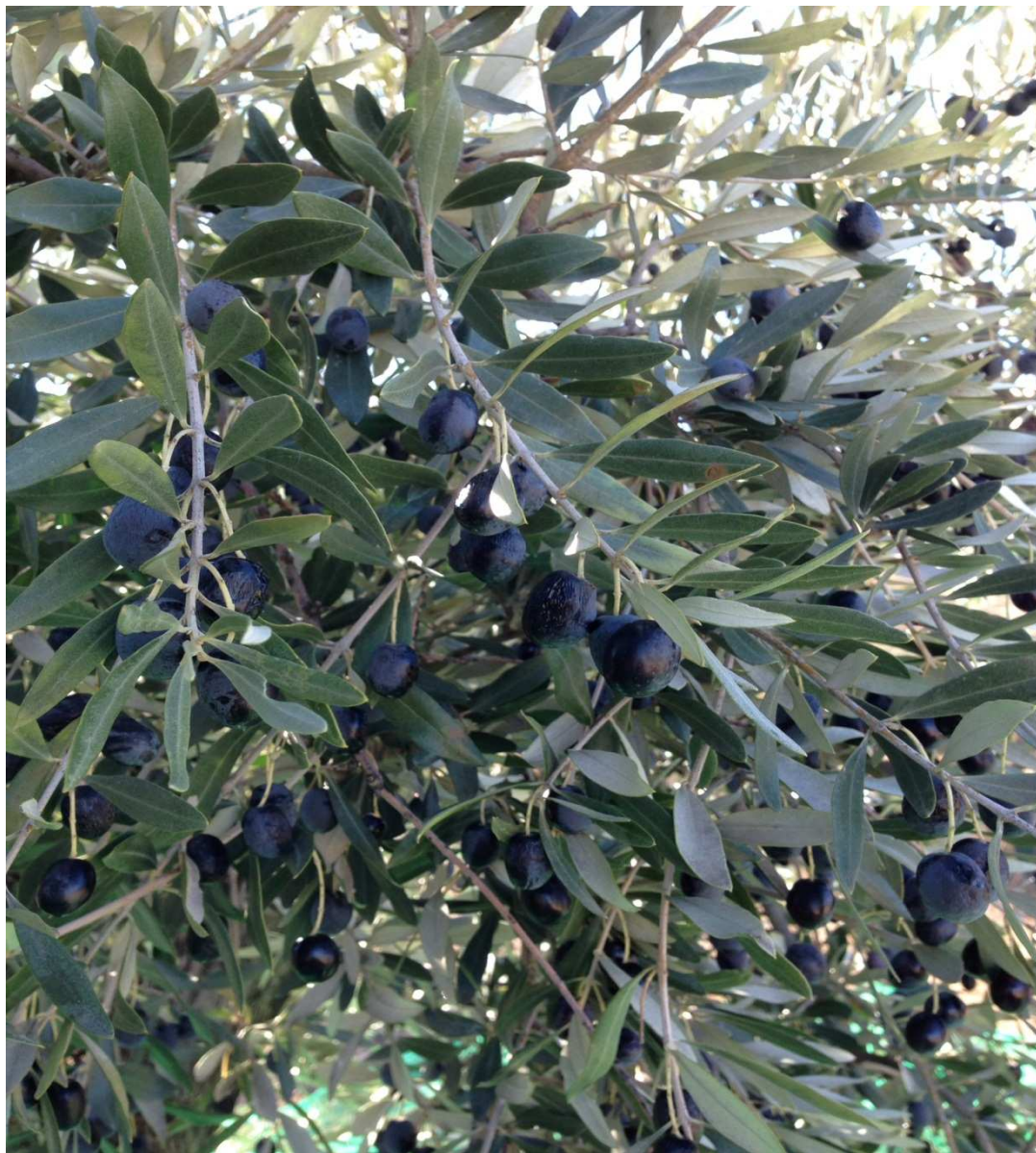
Olivos de Oliete