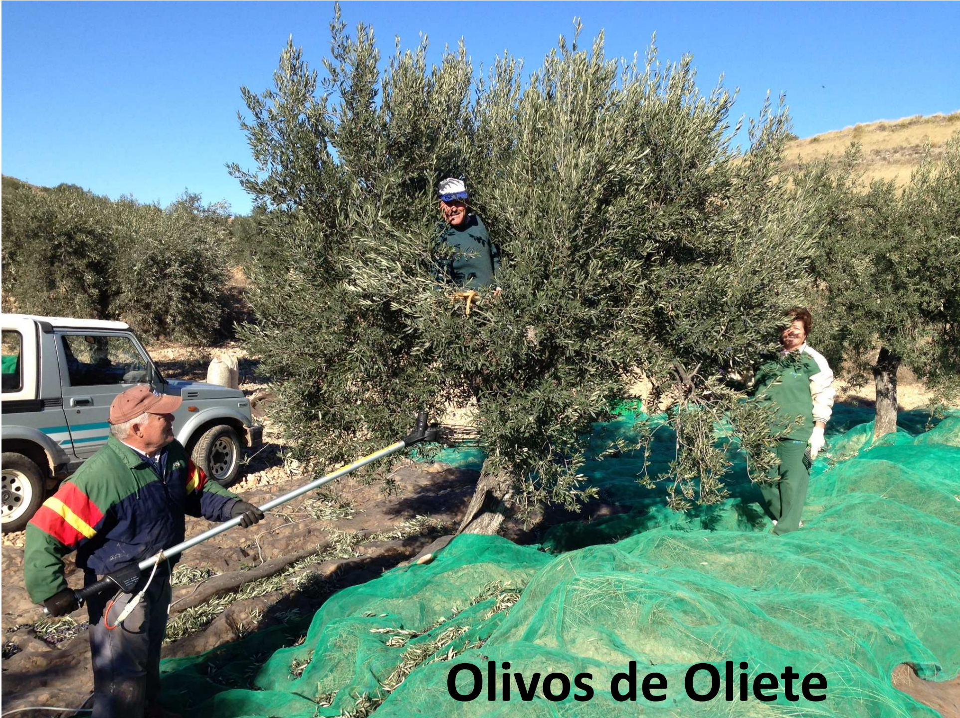
Olivos de Oliete